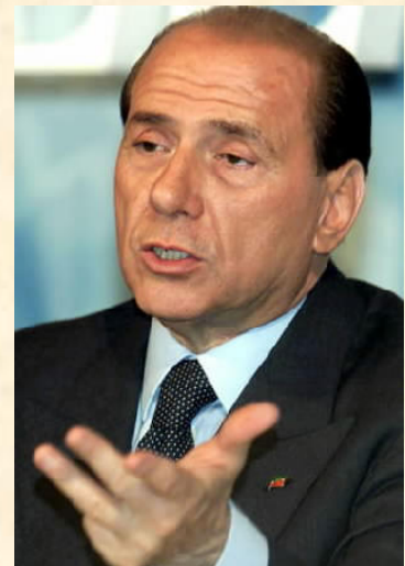
Silvio Berlusconi (1936- ??)