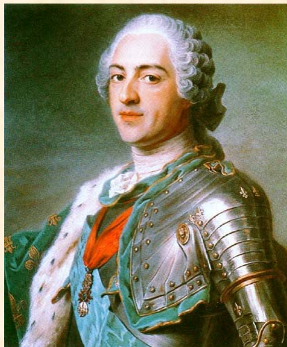
Luigi XV (1710-1774)