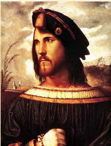
Cesare Borgia (1475-1507)