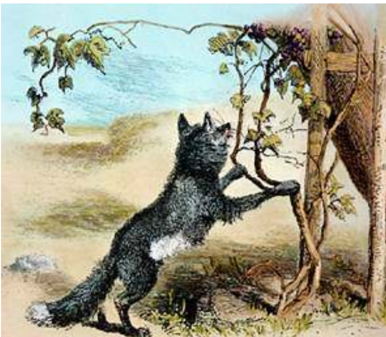
La volpe e l'uva